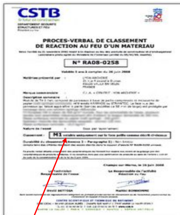
Exemple INDICE DE REACTION (M1)